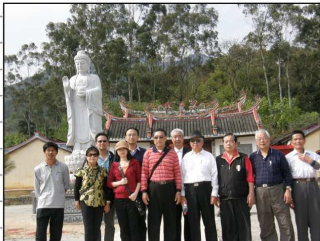
蘇洋永隆廟前的觀音石像。