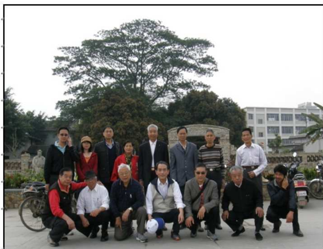
平和坂仔鄰居林語堂祖厝。