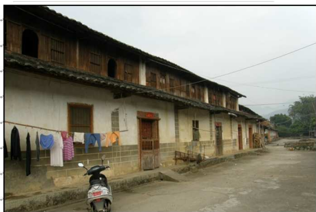
平和坂仔甘棠坑曾氏住家。

(編者註： 武 66 派：1640 尚彭，1611—1691，諡剛毅，配李氏慈儉，荷蘭時期最早自詔安縣渡台西螺一帶打工。清康熙 1684 年佔領台灣後，全家遷回平和縣城西門外陳坑鄉黃田村大塘下居住，其子衍井、衍嶺均渡台打工，孫興寶、興登、興玉等遷徙台灣。70 派嫡孫信義遷台時，背剛毅金斗到桃園大溪，交給 70 派傳面公，現安厝于大溪缺子信直公祖塔。見《平和譜》卷六 863 頁及譜表 660)