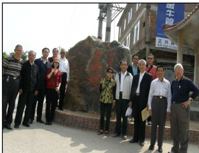
九峰往大埔公路旁的陳田鄉黃田村石碑。