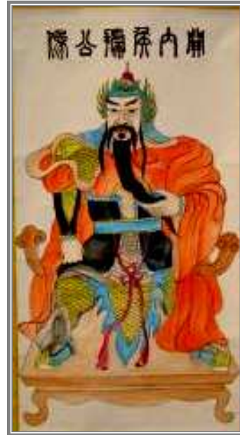
關內侯武城 15 派：前 10 曾據公像 公元(前 42~後 35)年

漢哀帝死亡（公元前 1 年），年僅九歲的平帝立，外戚王氏權力再起，王莽受詔輔政，以大司馬將軍總攬朝政，因功受封為「安漢公」。他利用機會收買人心，籠絡學者、士子上書歌功頌德。王莽見時機成熟，便弒平帝，立年僅二歲的孺子嬰為帝，自己攝政稱「假皇帝」。過了三年，受禪即天子位，改國號為「新」。