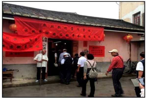
平和宗聖廟歡迎來訪賓客。