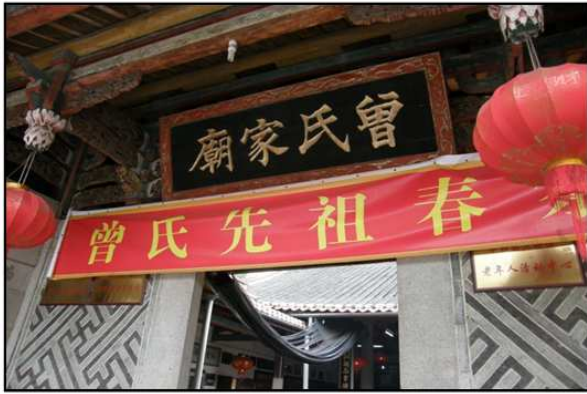
九峰曾氏家廟位於九峰鎮中心，明正德年間平和縣治築城于此地。