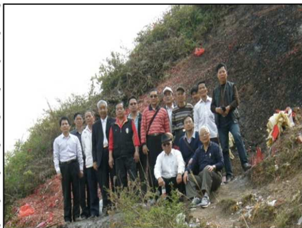
平和九峰“左插金釵”金堆墓前。