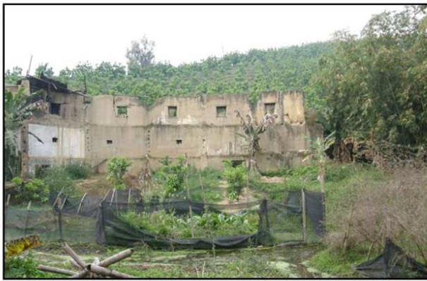
平和坂仔甘棠坑碧山樓寨遺址。