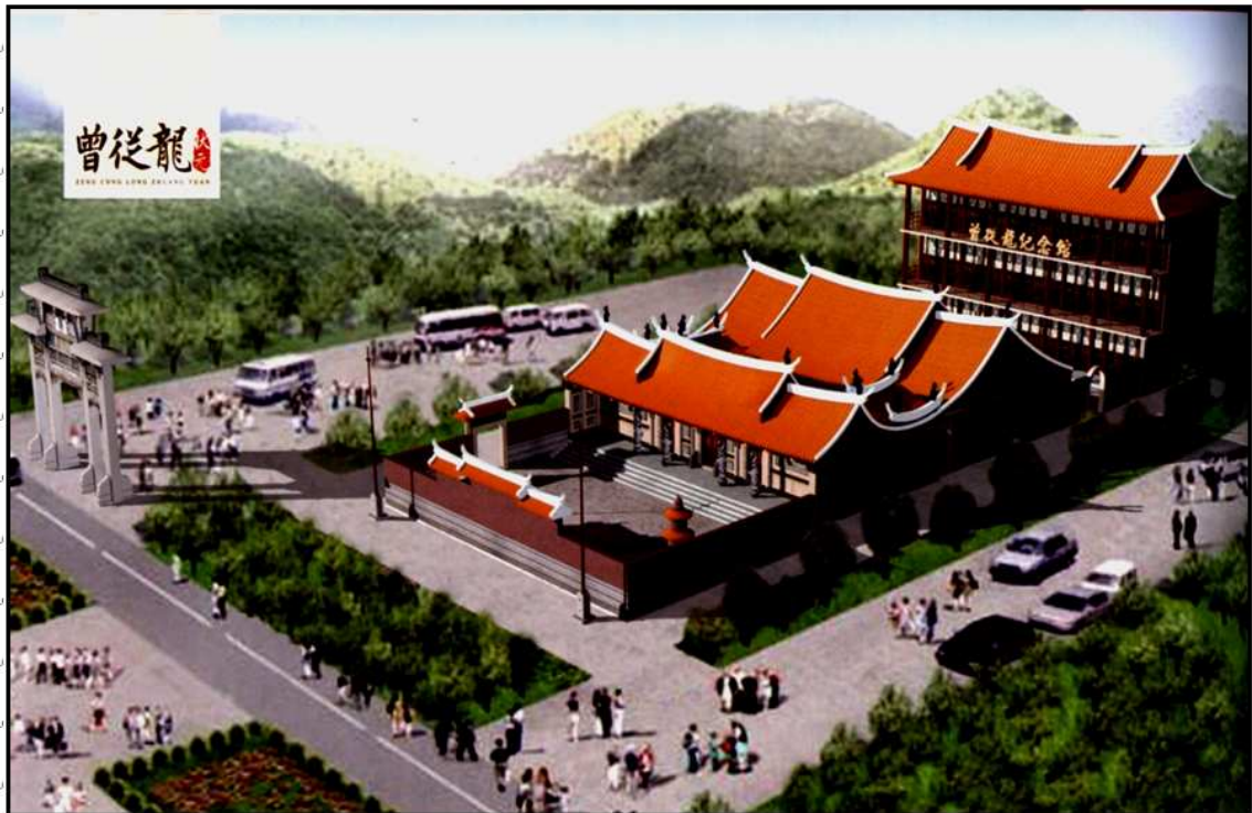
曾從龍狀元紀念館及西疇曾氏大宗祠

山 14 世 武 49 派: 1200 從龍，初名一龍，南宋慶元己未(1199 年)科狀元及第，宋寧宗御筆改名從龍，釋褐授宣議郎，奉國軍節度使，復除參知政事，陞知樞密院，享年 61 歲(1174-1235 年)，南宋贈少師。封清源郡公，別號雲帽居士，崇祀泉州府學鄉賢祠，配陳氏，子四：巽伯、履伯、頤伯、升伯。