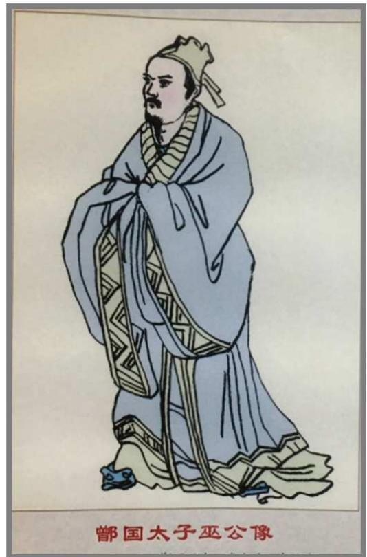
曾氏始祖 曾 1 世：前 580±20 曾巫

魯襄公八年起，莒連續三次(公元前 565、563、561 年)進攻魯國東境，劃定所佔鄆國疆界。魯昭公四年（公元前 538 年）九月，莒著丘公即位，未安撫鄆國遺民，鄆國叛莒，莒乃廢掉鄆國，鄆國終於為莒所滅。