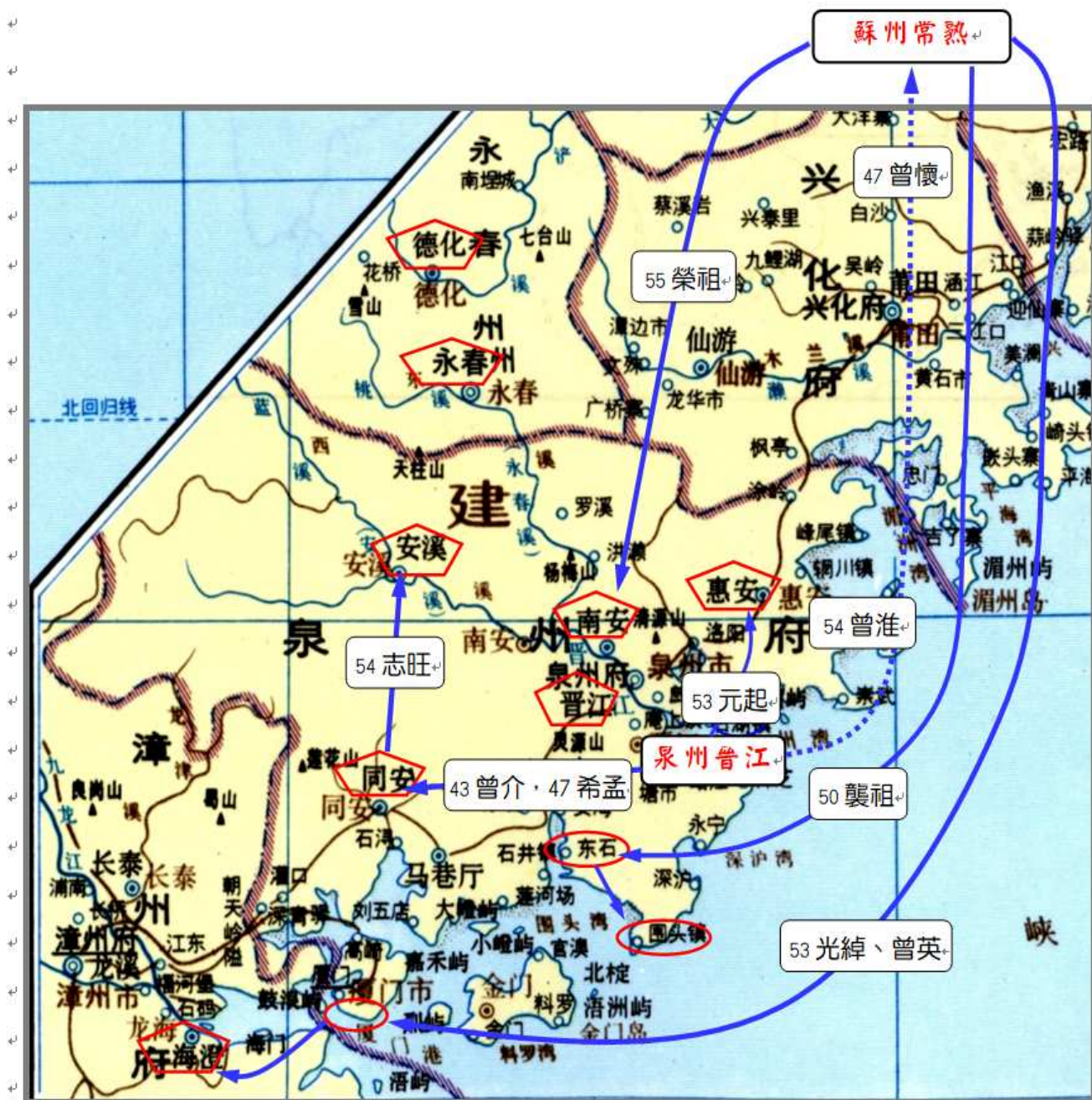
史地 6.40. 宋元泉州曾氏祖籍大遷徙